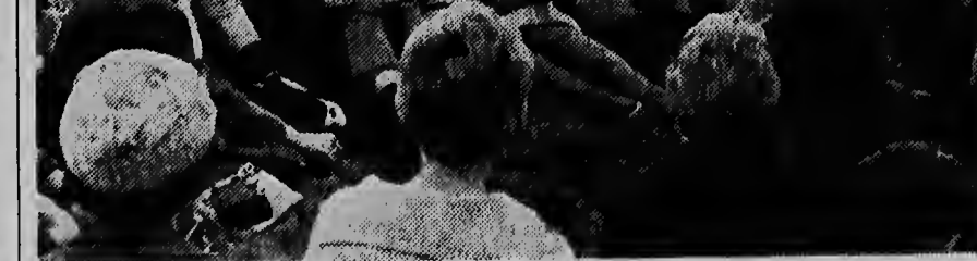
S.A.R. Prinses Beatrix a haci un bishita diamars na e Festival Juvenil Internacional 1962, cu a worde tene na Velp atrobe. Riba e portret nos ta mira e prinses, mientras e ta bebe thee huntu cu e participantenan na e festival.

Cu e total di 14 avion e compania "All Nippon Airways", ta hanja e flota di mas grandi di mundu di avionnan Friendship.